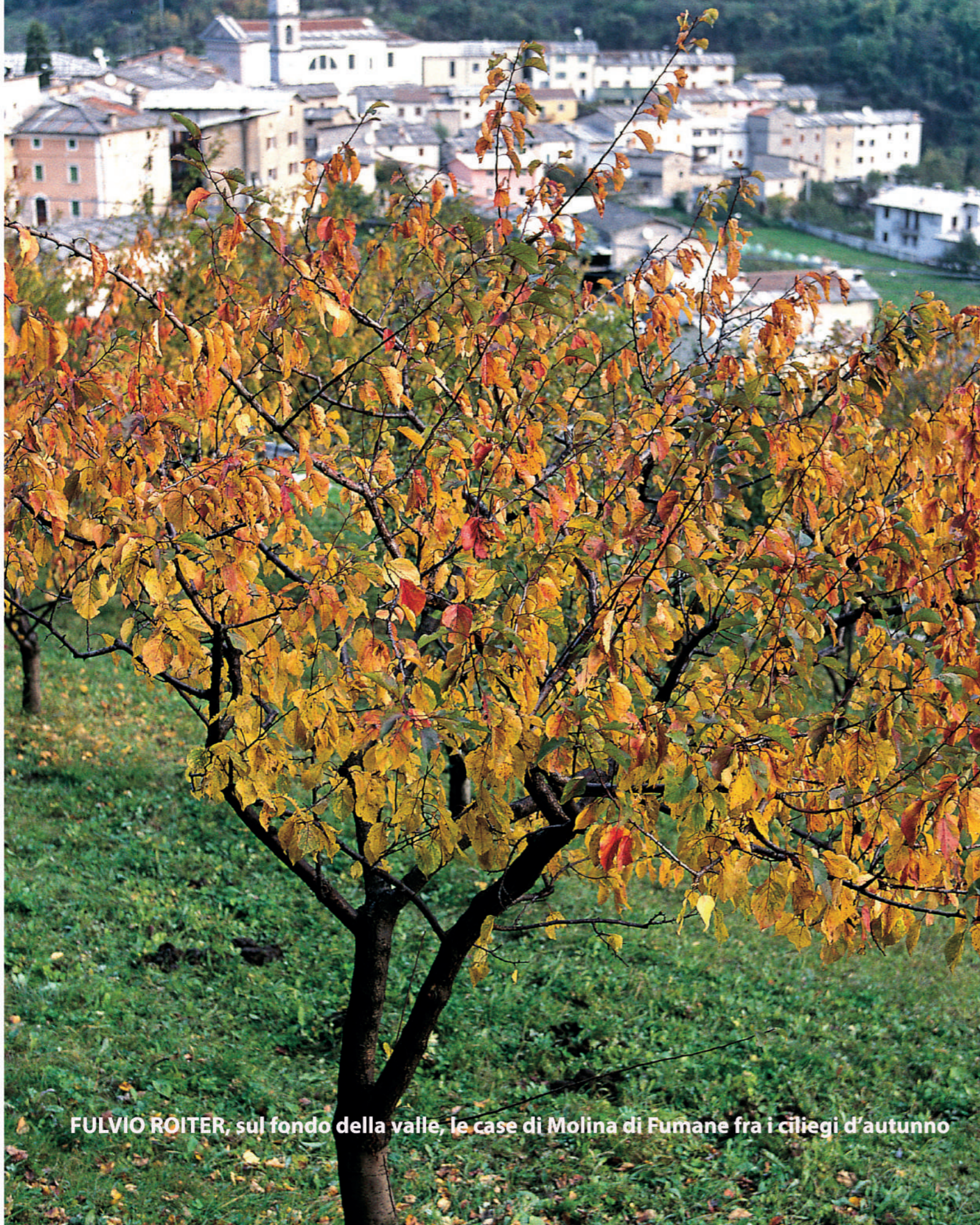
FULVIO ROITER, sul fondo della valle, le case di Molina di Fumane fra i ciliegi d'autunno